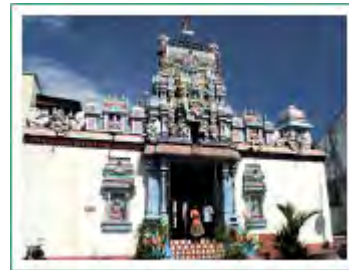
スリ・マハ・アリマン寺院