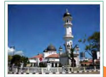
カピタン・クリン・モスク