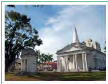
セント・ジョージ教会